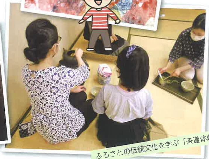
ふるさとの伝統文化を学ぶ「茶道体験」