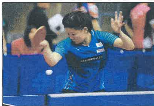
[新発田市在住の美遠選手も出場予定]

未来のパラリンピアンが新発田に集結！ 東京パラリンピックに出場した選手や、 地元新潟県の選手も参加するパラ卓球の 全国大会が当市で開催されます！！