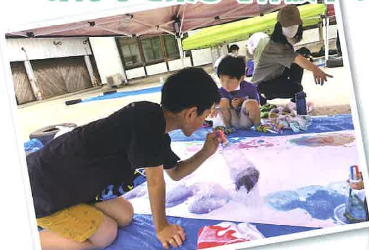
「シャボン玉アートを作ろう♪」 in 城山温泉