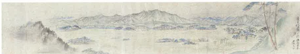
五十公野山名所画 (鷹待場より新保二王子遠景)