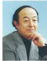
池辺 晋一郎 作曲家 (東京音楽大学名誉教授)