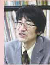
後藤 丹 作曲家 (上越教育大学名誉教授)