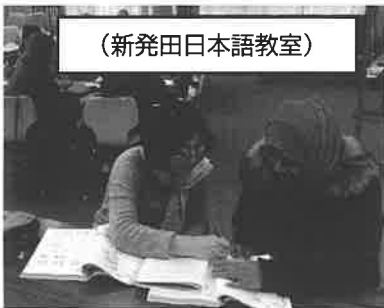
(新発田日本語教室)