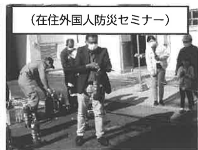
(在住外国人防災セミナー)