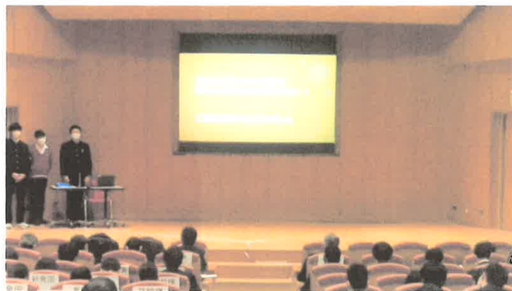
【中間プレゼンテーション当日の様子】