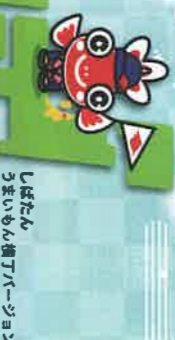
しばたん うまいもん横丁バージョン