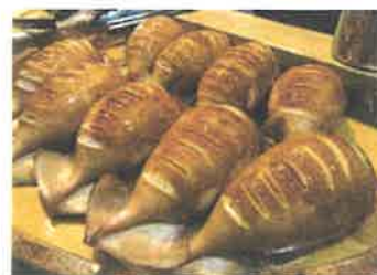
販売品目の一部 イチゴ大福、いかめし