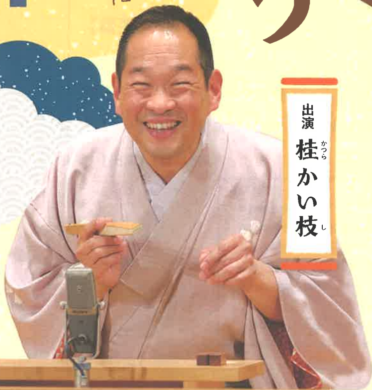
出演 桂 かい枝 かつら

子どもや外国人など、だれにでも わかりやすく伝えられるよう 簡単にした日本語『やさしい日本語』 での落語を楽しみましょう。