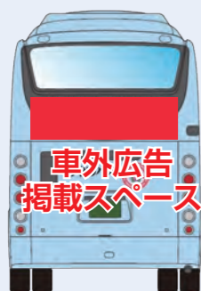
車外広告 掲載スペース