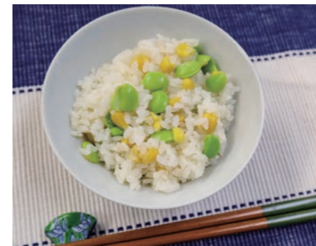
1人当たりエネルギー273kcal 塩分0.8g