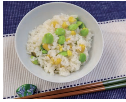
1人当たりエネルギー273kcal 塩分0.8g