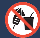
まつり会場 飲食禁止