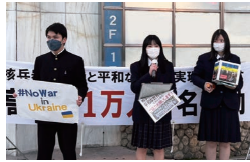
▲高校生1万人署名活動の様子

当市は、世界の全ての国が核兵器を速やかに廃絶し、平和な国際社会が築かれることを求め、平成9年に「核兵器廃絶平和都市」を宣言しました。この宣言に基づいて、さまざまなイベントを行っていますので、ぜひご参加ください。