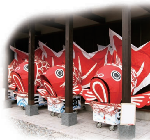
▲三之町町内会の金魚台輪

行事を行うのが難しい時代だからこそ、私たちが柔軟に対応しながら、誇りであるこの伝統文化を次の世代につないでいきたいです。