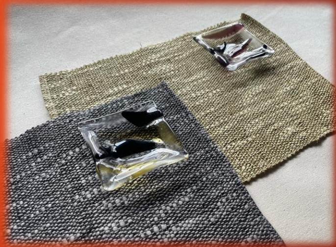
Bコース カフェサイズマット×2 小皿×2 (小皿サイズ：約8cm×8cm)