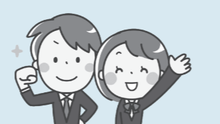
※学年は全て大会出場時のものです