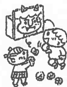
1月中旬以降 鬼さんも登場です