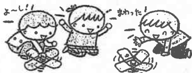
牛乳パックの花びらゴマ