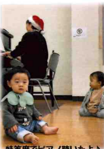
特等席でピアノ聴いたよ♪