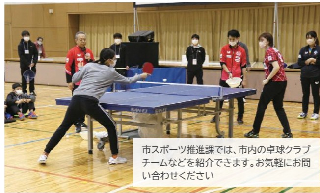
市スポーツ推進課では、市内の卓球クラブチームなどを紹介できます。お気軽にお問い合わせください