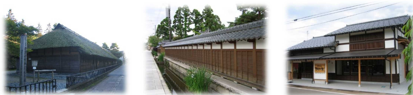
無彩色や低彩度の色彩で構成される歴史的景観