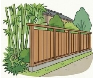
板塀の設置 上限15万円