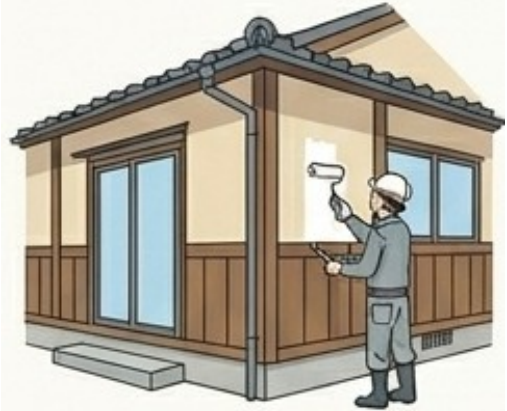
外壁の塗り替え 上限10万円