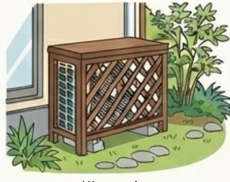
設備の遮へい 上限10万円