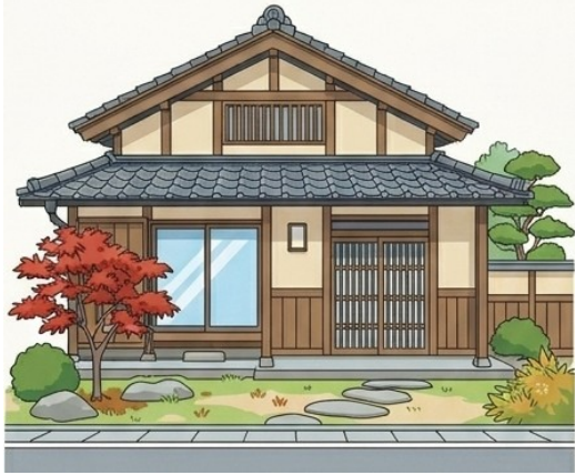
建物の新築・修繕 上限50万円