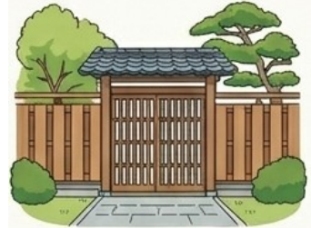
門の設置 上限15万円