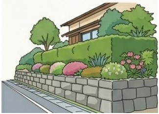
石垣の設置 上限15万円