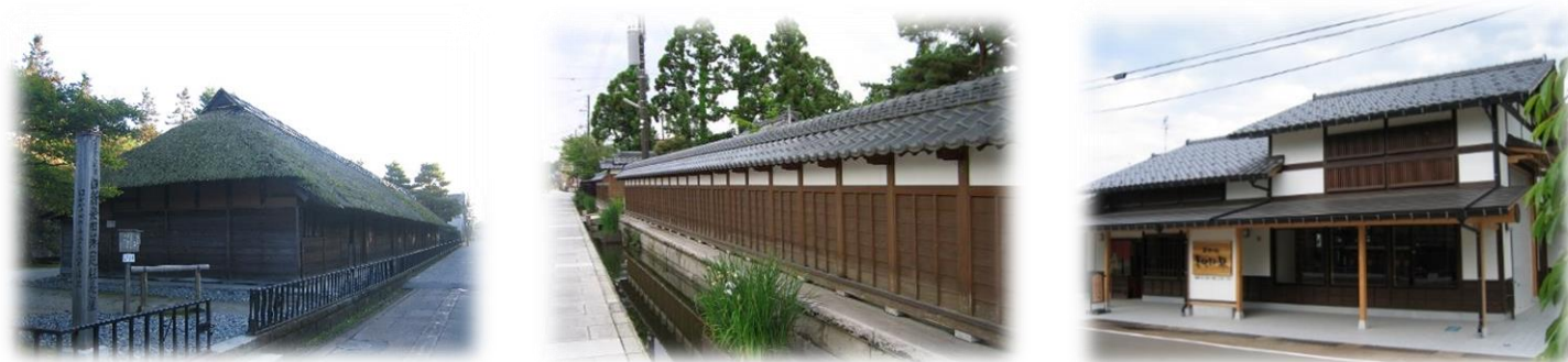
無彩色や低彩度の色彩で構成される歴史的景観