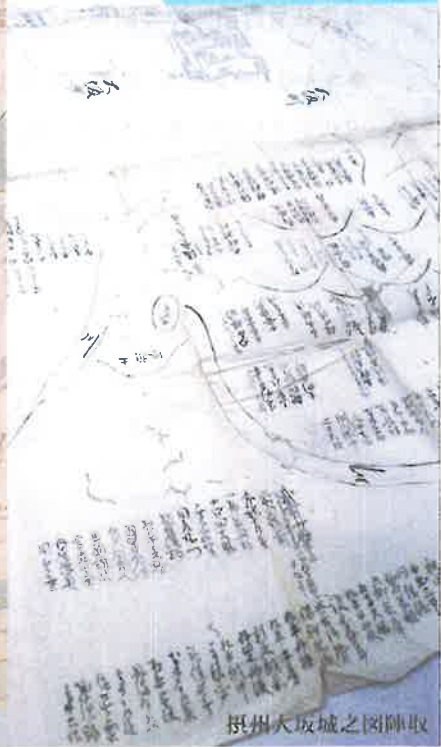
摂州大坂城之図陣取