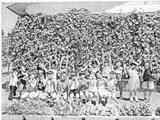
令和4年度 新発田市長賞【団体の部】