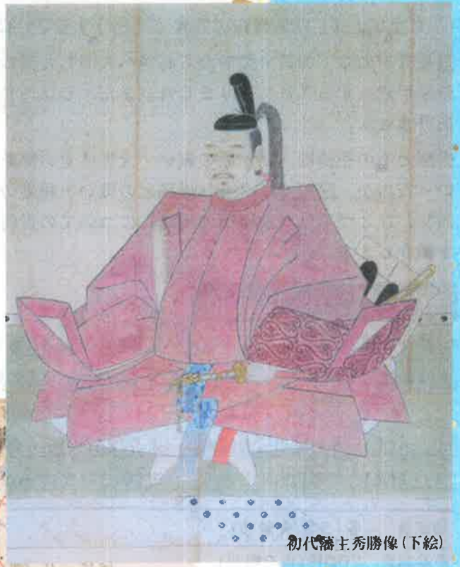
初代藩主秀勝像(下絵)