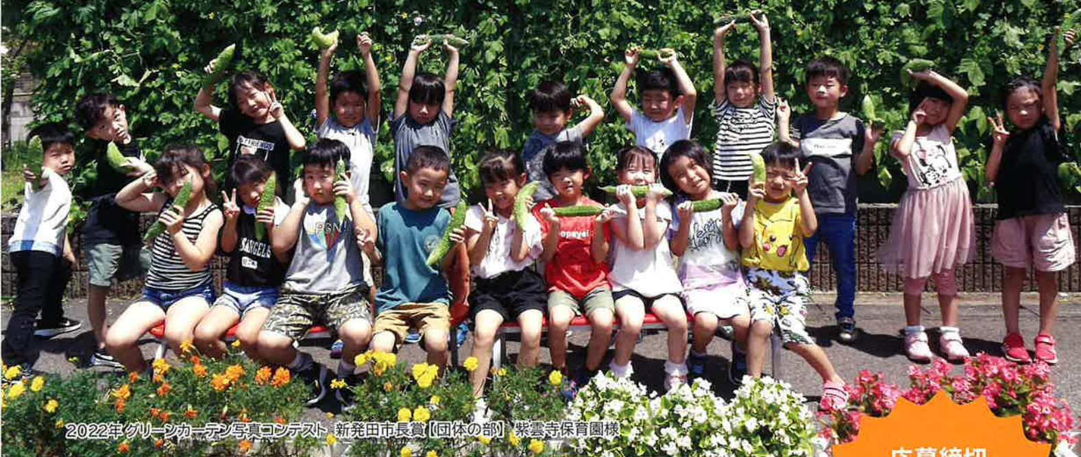
2022年グリーンカーテン写真コンテスト 新発田市長賞【団体の部】 紫雲寺保育園様

ご家庭や店舗・事務所、公共施設などに設置したグリーンカーテンを撮影した写真を募集します。※令和5年春以降に撮影したもの、植物の種類は問いません。