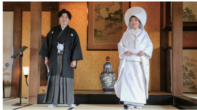
貸館に関するお問い合わせは蔵春閣(☎28-3255)