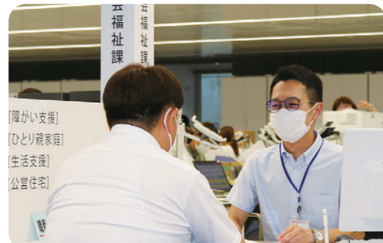
地域の方の異変を感じたら関係機関につなげて、相談を受けられる体制をつくります