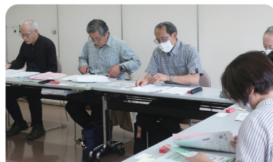
活動の充実のために研修などを行います