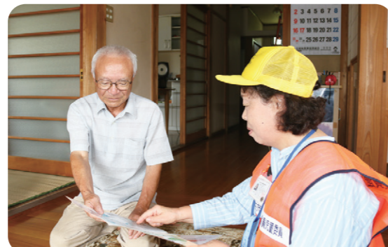
自宅を訪問し、高齢者や障がいのある方の安全確認や、悩み相談に応じます