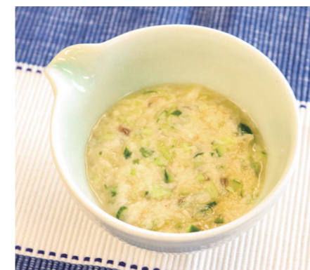
1人あたり エネルギー24kcal 塩分0.4g