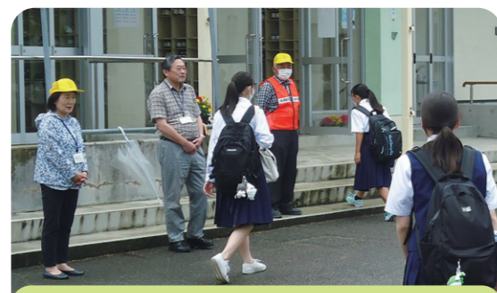
子どもたちが安全に暮らせる地域づくりのため、あいさつ運動に参加します