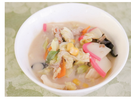
1人あたり エネルギー148kcal 塩分1.1g