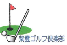
紫雲ゴルフ倶楽部