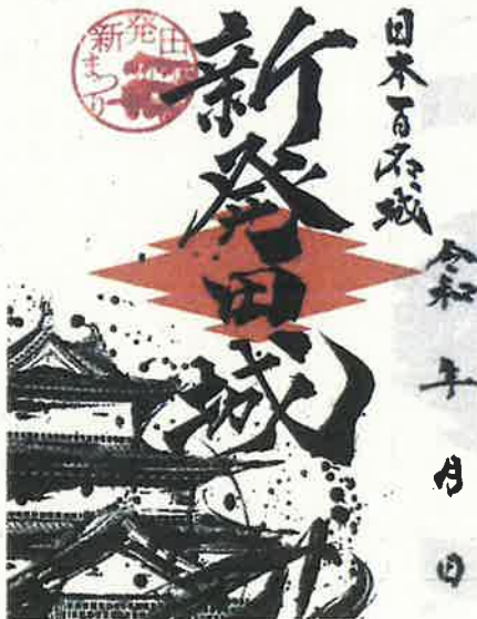
しばたまつり 限定御城印