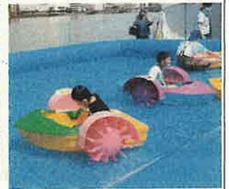
闇びらきアトラクション