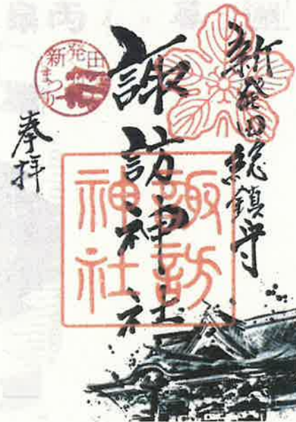
しばたまつり 限定御朱印