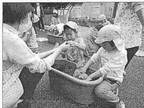
※昨年度の開催時の様子