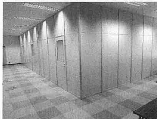
スタートアップ専用ブース (3 部屋)