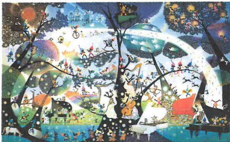
「こびとの楽園」© 2005 Seiji Fujishiro