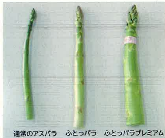
通常のアスパラ ふとっパラ ふとっパラプレミアム