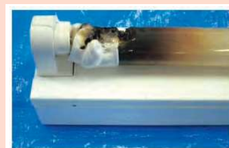
直管LEDランプの焼損例