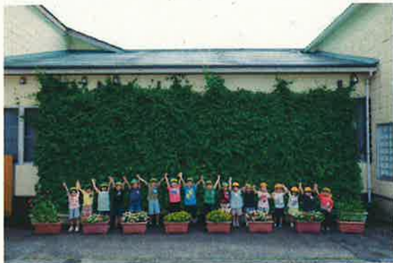
令和6年度 新発田市長賞【団体の部】