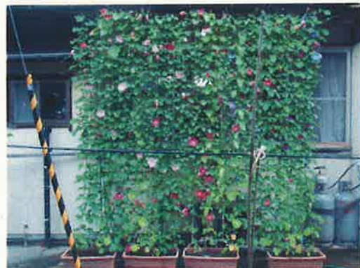
令和6年度 新発田市長賞【個人の部】