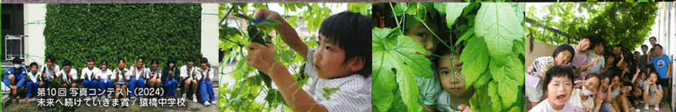
第10回 写真コンテスト(2024) 未来へ続けていけます賞 / 猿橋中学校