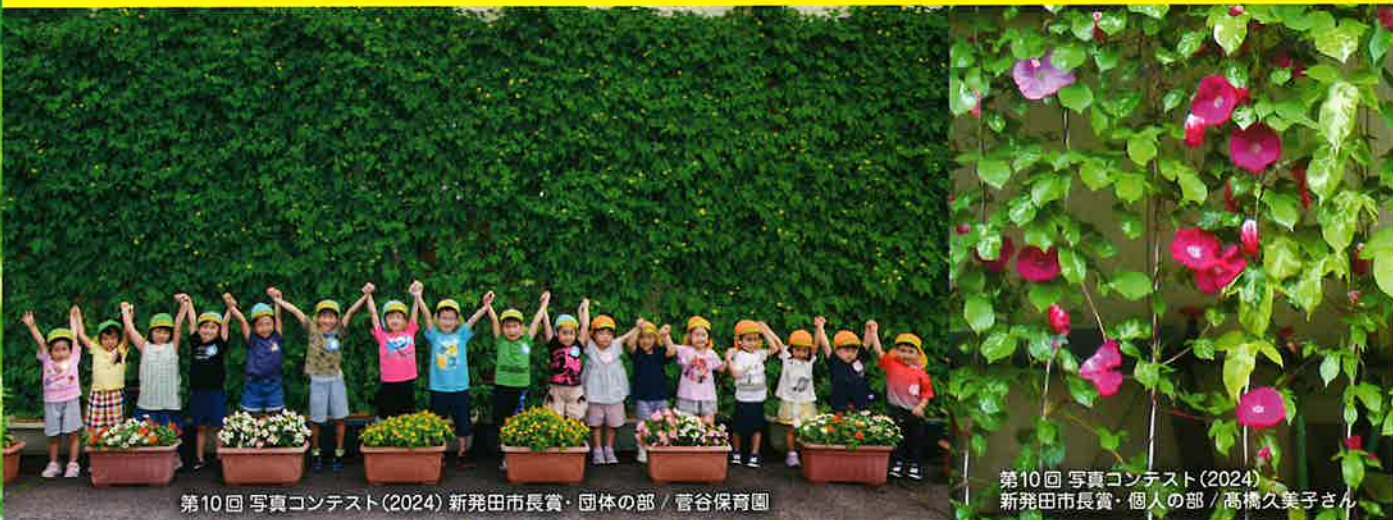
第10回 写真コンテスト(2024) 新発田市長賞・団体の部 / 菅谷保育園