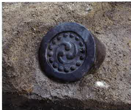
軒丸瓦（新発田城跡 第28地点）