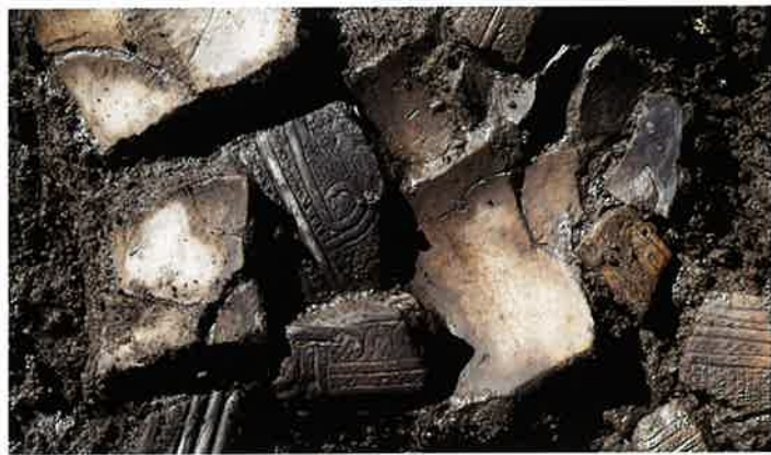
縄文土器（北野地遺跡）