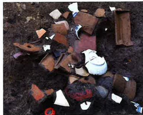
陶磁器（新発田城跡 第33地点）