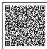
6km コース 申込