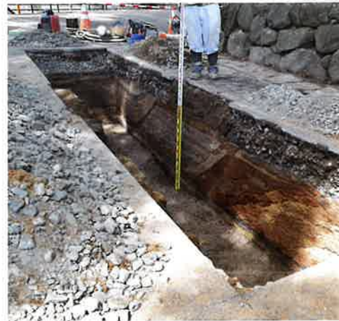
土橋門付近の整地層（新発田城跡 第34地点）