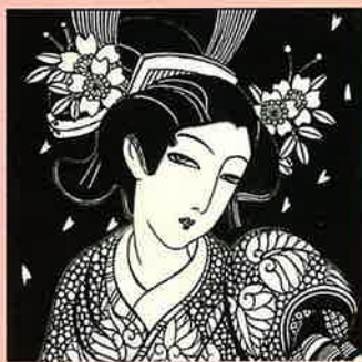
『名残の絵姿』挿絵 (1925年頃)