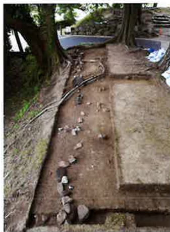
土堀の基礎（新発田城跡 第34地点）