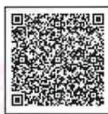
10km コース 申込