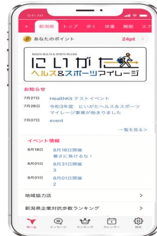
新潟県の健康アプリ にいがたヘルス&スポーツマイレージ

※目標歩数:チーム全体の平均歩数が1日8,000歩以上or1日5,000歩以上 (平均歩数=参加者全員の合計歩数÷14日間÷参加人数)