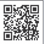
▲しばた町めぐりホームページ

令和7年7月から運行しているJR新潟駅と月岡温泉、月岡温泉とJR新発田駅を結ぶ直行バスのダイヤを1月31日④まで現行のまま延長し、2月1日④から新ダイヤに変更します。詳しくは「しばた町めぐり」ホームページをご覧ください。