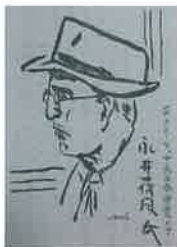
『日本文学全集 現代編20』 「永井荷風集」 絵・宮嶋美明 (1962年 河出書房新社)