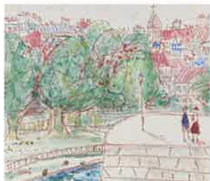
「パリ風景」 宮嶋美明