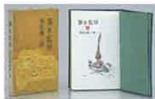
柴田錬三郎『第8監房』 装幀・絵・宮嶋美明(1959年 光風社)