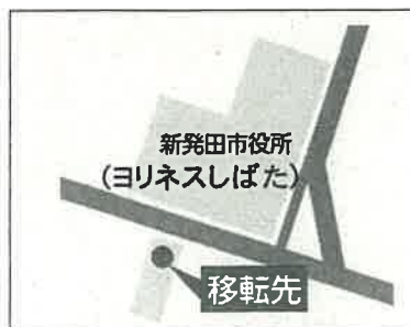
まちなか観光案内所