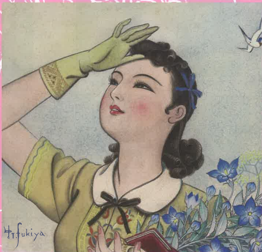
「紺青」表紙原画 (1947年11月号 雄鶏社) 落谷虹児

開催時間：午前9時～午後5時（入館券の販売は午後4時30分までとなります。） 休館日：月曜日（但し、祝日の場合は開館し、翌火曜日を振替休館といたします。） 入館料：一般・大学生550円（有料入館者20名様以上は団体料金440円）、高校生230円、小・中学生120円 ※障がい者手帳・療育手帳をお持ちの方は無料（受付で手帳をご提示ください。） 主催：新発田市、新発田市教育委員会、落谷虹児記念館 協力：宮島かをり、木村悦雄・正子コレクション