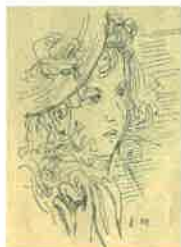
「ボナアルの黄昏」 作・林芙美子 /絵・宮嶋美明 (『新女苑』1947年4月号 実業之日本社)