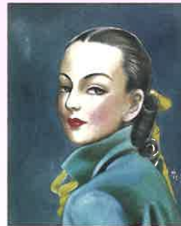
「みどり」 落谷虹児 (『令女界』1949年12月号表紙原画)