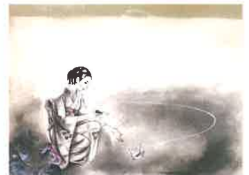
「わかれ」 落谷虹児 (『令女界』1947年8月号口絵原画)