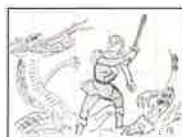
『グリム童話宝玉集』 絵・宮嶋美明(1957年 宝文館)