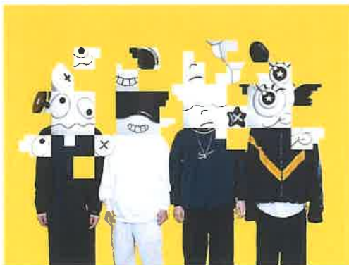
4 月 21 日に行われた認定式の様子 ⇒

今後、“少年ああああ”さんには、高い注目度を活かして SNS やメディア出演を通して新発田市を大々的に PR していただきます。