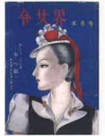
『令女界』(1949年5月号 宝文館) 「菜と菓子と」(作・勝田豪/絵・宮嶋美明 表紙・落谷虹児)