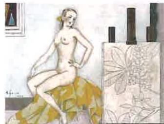
「マロニエの構図」 落谷虹児 (『令女界』1946年6月号口絵原画)