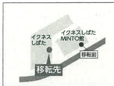
えきまえ観光案内所