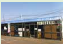
JA北越後農産物直売所

住 新発田市諏訪町2丁目3-28 ☎ 0254-22-1888 営 9:00~16:30 休 なし 駐 10台