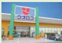
ウオロク東新町店

住 新発田市緑町3丁目3-23 ☎ 0254-23-6000 営 9:00~22:00 休 なし 駐 540台