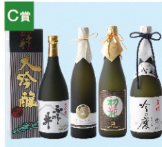
C賞 新発田 純米大吟醸・ 大吟醸飲み比べセット (720mlx4本) [4名さま] ※応募は20歳以上に限ります。