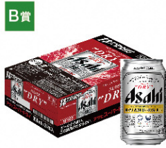
B賞 アサヒビール特別賞 アサヒスーパードライ 1年分 [2名さま] ※応募は20歳以上に限ります。