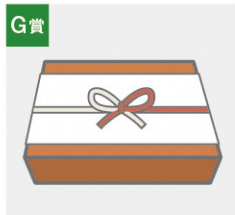
G賞 新発田市、胎内市、聖籠町 定住自立圏内特産品 胎内市または聖籠町の うまいもの [5名さま]