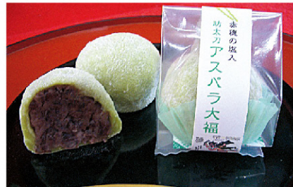
助太刀 アスパラ大福…151円(税込)