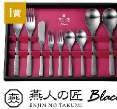
I賞 燕人の匠ブラック カトラリーセット [4名さま]