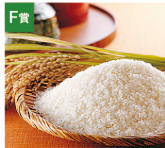
F賞 新発田のおいしい お米コンテスト 上位入賞米 (5kg) [5名さま]