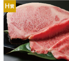
H賞 新発田牛 (15,000円分相当) [5名さま]

さらに! Wチャンス!! お楽しみ賞 164名さま アスパラくんグッズ 15名さま