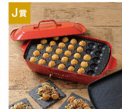
J賞 ブルーノ ホットプレート グランデサイズ カラー: レッド [4名さま]

●賞品写真はイメージです。 ※新発田市は胎内市、聖籠町と人口定住のために必要な生活機能の確保に向けて、定住自立圏形成協定を締結しています。