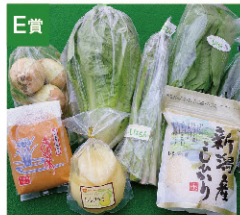
E賞 新発田農産物 詰め合わせ (5,000円相当) [5名さま]