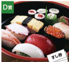
D賞 全国共通すし券 (10,000円) [5名さま]

さらに! Wチャンス!! お楽しみ賞 164名さま アスパラくんグッズ 15名さま