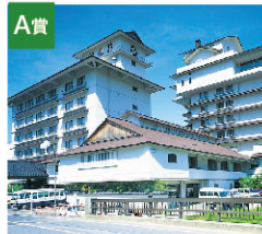
A賞 農協観光特別賞 月岡温泉 旅館ペア宿泊券 (1泊2食付き) [2名さま]